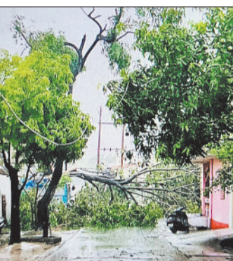
टूटा बिजली का पोल।