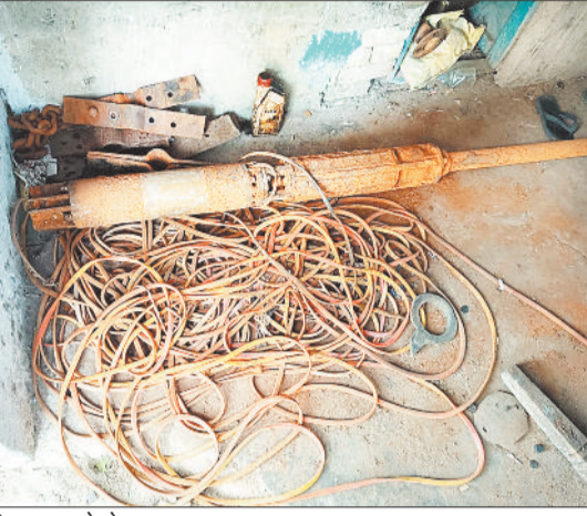
बिगड़ा पड़ा बोरवेल।

कर्मचारियों ने प्रबंधन को आवेदन दिया गया है इसके बावजूद एसईसीएल प्रबंधन इस ओर ध्यान नहीं दे रहा है।