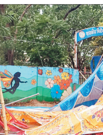
तेज आंधी से उड़ा टेंट।

जारी रहा और शाम होते-होते जमकर आंधी तूफान और बारिश हुई। जिसकी वजह से शहर की विद्युत व्यवस्था पूरी तरह से बाधित हो गई थी। देर रात शहर के अलग-अलग क्षेत्र में विद्युत विभाग के अधिकारी कर्मचारियों की टीम लगी रही। जिसके बाद विद्युत व्यवस्था को बहाल किया जा सका। उल्लेखनीय है कि मंगलवार की सुबह से ही मौसम में हल्की ठंडक थी और तेज आंधी तूफान शुरू हो गई और तेज बौदल छाए हुए थे। शाम होने के पहले ही तेज आंधी तूफान शुरू हो गई और तेज अंधड़ की वजह से शहर के कई इलाकों में