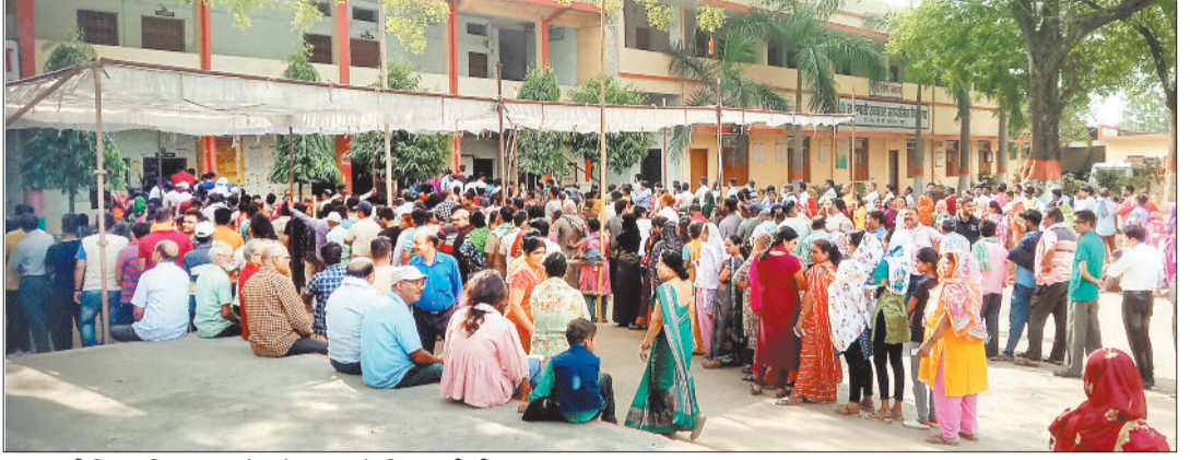
सरस्वती शिशु मंदिर मतदान केन्द्र में मतदान के लिए पहुंची भीड़।