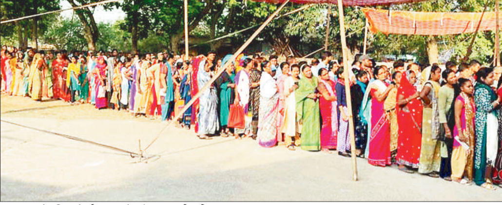
मतदान करने महिलाओं की मतदान केन्द्र के बाहर लगी लंबी कतार।

कोरबा। जिले में पारदर्शी और शांतिपूर्ण मतदान हो इसके लिए तमाम व्यवस्था की गई। मतदान केन्द्रों में सीसीटीवी कैमरा लगाने के साथ ही उनकी निगरानी होती। जिले के चिन्हित 544 मतदान केन्द्रों में वेबकास्टिंग की जाती रही। कंट्रोल रूम कलेक्टर सभाक्ष से टीम द्वारा निगरानी रखी जा रही है।