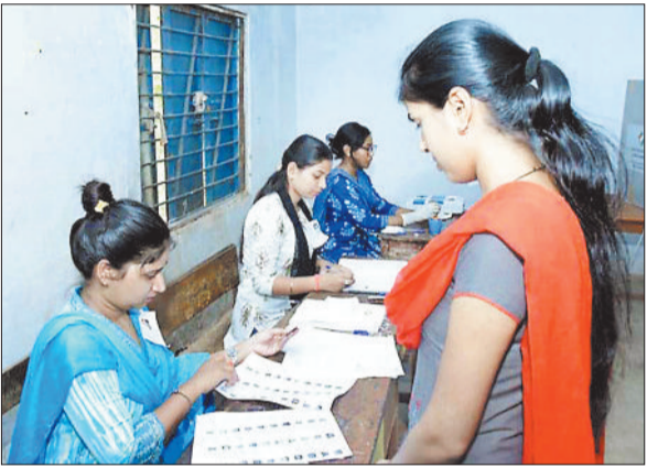
कोरबा विधानसभा में मतदान की जिम्मेदारी संभालती महिला कर्मचारी।

कोरबा लोकसभा क्षेत्र से 27 प्रत्याशी चुनाव मैदान में हैं। 8 विधानसभा के 16 लाख से ज्यादा पंजीकृत मतदाता हैं, जो अपना सांसद चुनने मतदान केन्द्रों में वोट डालने पहुंचे। सुरक्षा को लेकर पुख्ता इंतजाम देखने को मिला। पहले पहुंचे लोग बूथ के सामने खड़े मतदान शुरू होने का इंतजार करते नजर आए। कई लोग परिवार समेत पहुंच चुके थे और उत्साह के साथ अपनी बारी का इंतजार करने लगे। मतदान को लेकर मतदाताओं में जागरूकता दिखाई। जनप्रतिनिधियों के साथ वीआईपी प्रशासनिक अधिकारी वोट डालने पहुंचे हुए थे। प्रत्येक चरण मतदान का प्रतिशत जानने में लोग इच्छुक नजर आए। मौसम में सुबह से ठंडक होने के कारण