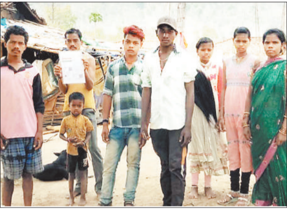
पहाड़ी कोरबा परिवार।

हरिभूमि न्यूज | कोरबा मंगलवार को लोकसभा चुनाव के तीसरे चरण के तहत कोरबा जिले के 1087 मतदान केन्द्रों में सुबह 7 बजे से शाम 6 बजे तक वोट डाले गए। अंतिम जानकारी तक औसत