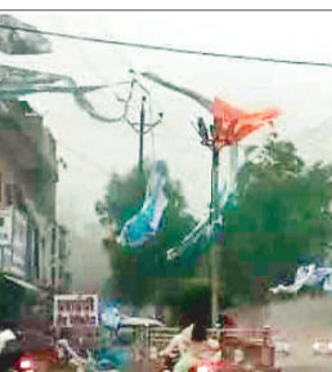
तेज आंधी बारिश से सड़कों में छापी घूल।