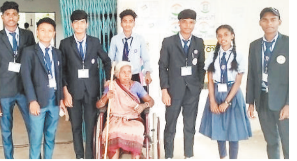
बुजुर्ग महिला मतदाता के साथ रोसेयो के सदस्य।

को जल संकट से जूझना पड़ रहा है। कॉलोनीवासी नगर निगम के द्वारा लगाए गए पंप पर आश्रित हैं।