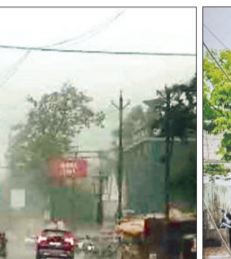
पेड़ से गिरी डगाल।