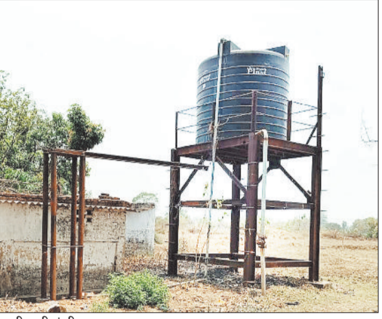
सूखी पानी टंकी।

कोल कर्मी व उनके परिजनों को भीषण गर्मी में पानी के लिए जदोजहद करना पड़ रहा है। एसईसीएल के कटाईनार में पिछले एक माह से पानी सप्लाई बाधित है जिसकी वजह से हाहाकार मचा हुआ है। एसईसीएल प्रबंधन को इसकी शिकायत की गई है। बावजूद इसके अब तक पानी सप्लाई की व्यवस्था नहीं की जा सकी है। कटाईनार एसईसीएल माइनस कॉलोनी में एक माह से पानी सप्लाई बंद है। जिसके कारण एसईसीएल कर्मी एवं उनके परिवार को पानी के बिना भीषण गर्मी में परेशानियों का सामना करना पड़ रहा है। इस संबंध में कुछ