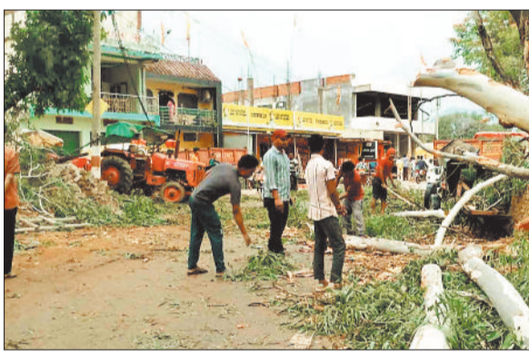
उखड़े पेड़ को हटाते विद्युतकर्मियों।